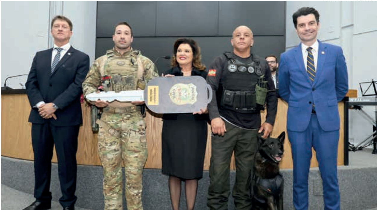
ROBERTO ZACARIAS / SECOM

Edição 130. Ano 11. JULHO 2025. Distribuição Gratuita. anuncie@jornalforquilha.com.br